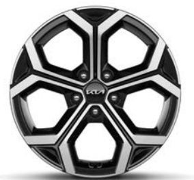
18-Zoll-Leichtmetallfelgen, nur für Spirit (Hybrid und Plug-in Hybrid)

*Verfügbarkeit abhängig von gewählter Außenfarbe.