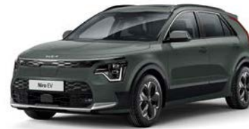
Cityscape Grün Metallic (CGE)