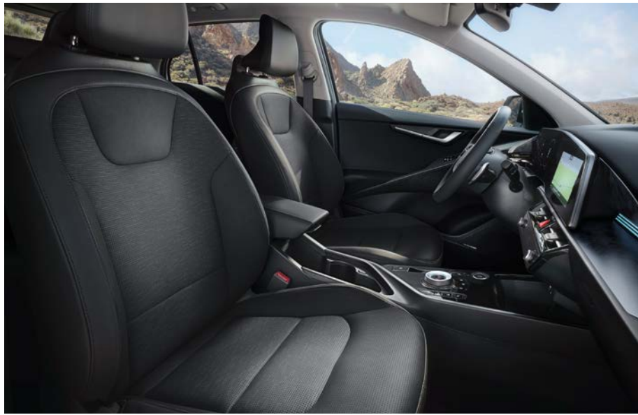
Sitzbezüge in hochwertiger Ledernachbildung, Charcoal (CCV) (Inspiration).