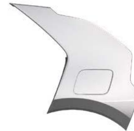
Stahlgrau Metallic (KLG), nur für EV