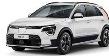
Snow White Pearl (SWP)