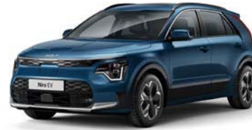
Mineralblau Metallic (M4B)