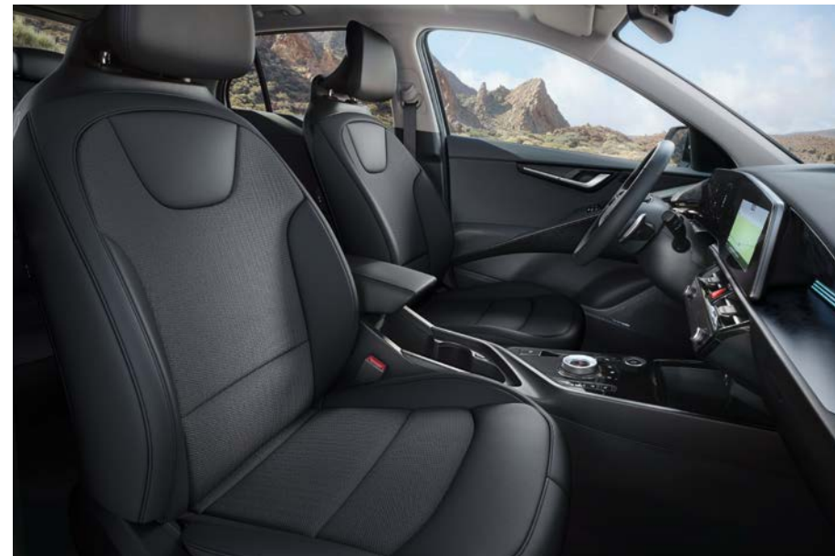
Sitzbezüge in Stoff-Leder-Kombination (mit hochwertiger Ledernachbildung), Charcoal-Grau (DFS) (optional für Vision).