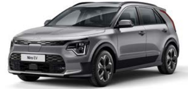
Stahlgrau Metallic (KLG)