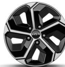
16-Zoll-Leichtmetallfelgen, serienmäßig bei Hybrid und Plug-in Hybrid