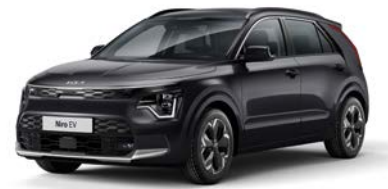
Auroraschwarz Metallic (ABP)