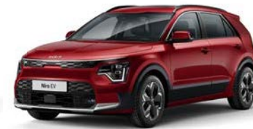
Runway Rot Metallic (CR5)