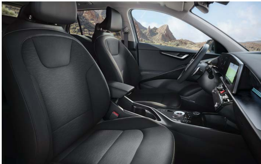
Sitzbezüge in hochwertiger Ledernachbildung, Charcoal-Grau (DFS) (optional für Inspiration).