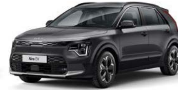
Interstellar Grau Metallic (AGT)