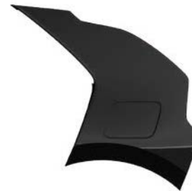
Auroraschwarz Metallic (ABP)