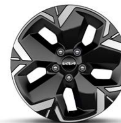
17-Zoll-Leichtmetallfelgen, nur für EV