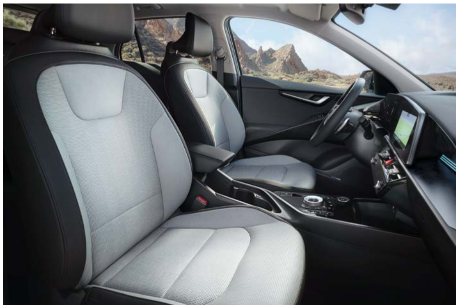
Sitzbezüge in hochwertiger Ledernachbildung, Bright (GYT) (optional für Inspiration).