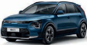
Mineralblau Metallic (M4B)