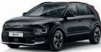
Auroraschwarz Metallic (ABP)