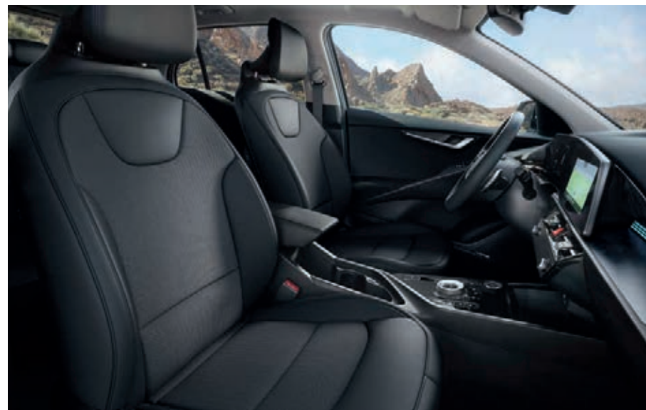
Sitzbezüge in Stoff-Leder- Kombination (mit hochwertiger Ledernachbildung), Charcoal (CCV) (Vision).