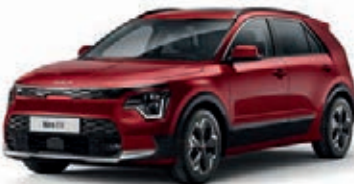
Runway Rot Metallic (CR5)