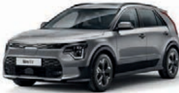
Stahlgrau Metallic (KLG)