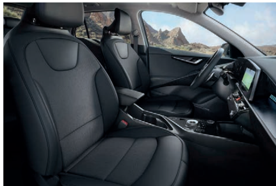
Sitzbezüge in Stoff-Leder- Kombination (mit hochwertiger Ledernachbildung), Charcoal- Grau (DFS) (optional für Vision).