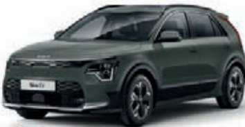
Cityscape Grün Metallic (CGE)