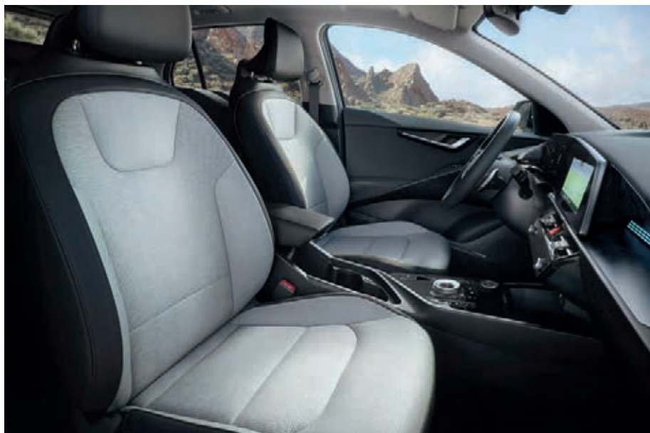
Sitzbezüge in hochwertiger Ledernachbildung, Bright (GYT) (optional für Spirit und Inspiration).