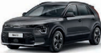
Interstellar Grau Metallic (AGT)